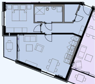
Beispiel 3 Grundriss Wohnung ca. 64 qm